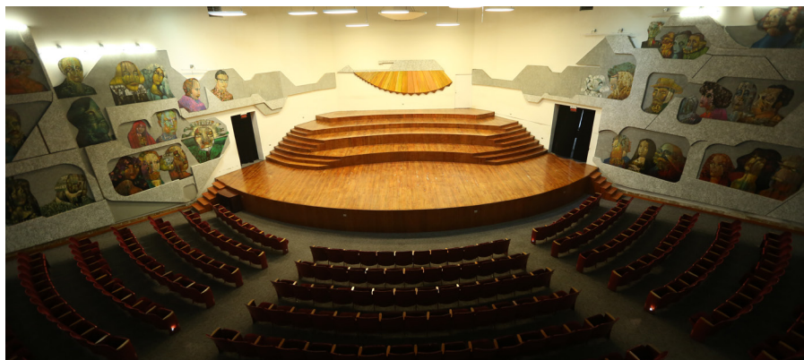
Auditorio del Conservatorio Nacional de Música Germán Alcántara

Otra de las obras más emblemáticas del Maestro Efraín Recinos son los Difusores Acústicos dentro del Conservatorio Nacional de Música "Germán Alcántara". El auditorium del Conservatorio se caracterizó por ser la sala de espectáculos artísticos más importantes de la Ciudad de Guatemala entre los años 50 y 70 (en los años 80 dejó de ser el centro principal de presentaciones).