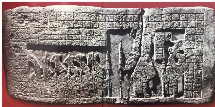
Guarda del Libro Popol Wuj: Dintel 2 de Piedras Negras (Petén), en el que aparece el Gobernador 2, acompañado por seis señores ataviados con trajes de guerreros (667 DC). Museo Nacional de Arqueología y Etnología, en Guatemala.

Con el objetivo de promover el estudio, comprensión y valoración del pasado prehispánico en Mesoamérica, la Universidad Mesoamericana publica en el 2018 el libro No.6 Popol Wuj, Nueva Traducción y Comentarios, donde Robert Carmack, académico, antropólogo y mayista estadounidense, en Anotaciones compendia y analiza en forma crítica distintas interpretaciones hechas por destacados mayistas sobre los principales relatos de la cosmovisión e historia K'iche' contenidos en el Popol Wuj.