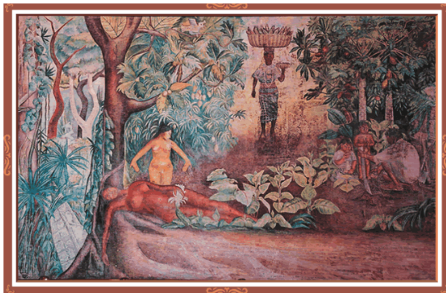
Fresco, Vestíbulo Museo Universidad de San Carlos de Guatemala.