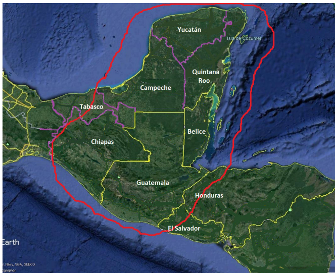
Gráfica 1. Se observa delimitada en rojo el Área Maya y los diferentes países que la conforman, así como los Estados de la República Mexicana.