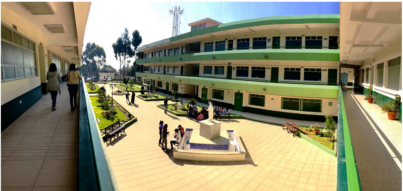
Edificio de Medicina, Sede Quetzaltenango.

De esta manera la Universidad Mesoamericana contribuye al desarrollo de Guatemala, y en especial, de Quetzaltenango y la Región del Occidente, en la formación de profesionales de la salud.