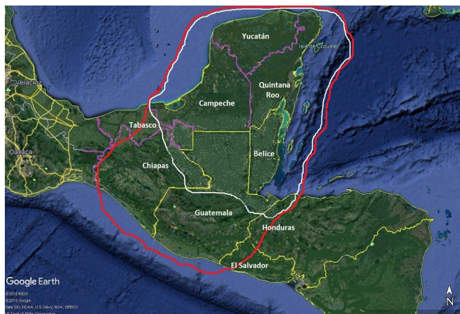
Gráfica 3. En color rojo se delimita el área maya y en color blanco las tierras bajas mayas.

pas. Fig. 3), ya que esos hábitats que en promedio no superaban los 100 metros sobre el nivel de mar, fueron la fuente de alimento por varios miles de años de los grupos cazadores-recolectores que las habitaron.